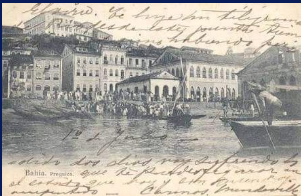
A cidade do Salvador no início do século XX, onde se vê a tradicional Rua da Preguiça, com seus sobrados centenários e seus barcos.